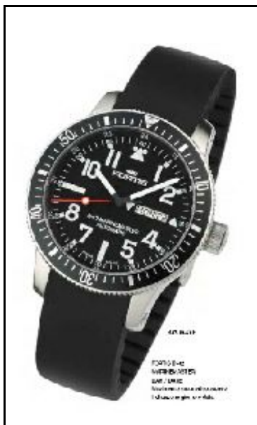
Fortis B42 MarineMaster

Oggi gli orologi Fortis appartengono all'equipaggiamento ufficiale di alcune squadriglie internazionali, come quella ungherese e portoghese, e alla squadra di acrobazia aerea taiwanese, per le quali è stata realizzata una serie limitata e numerata che riporta il logo della squadriglia sul quadrante.